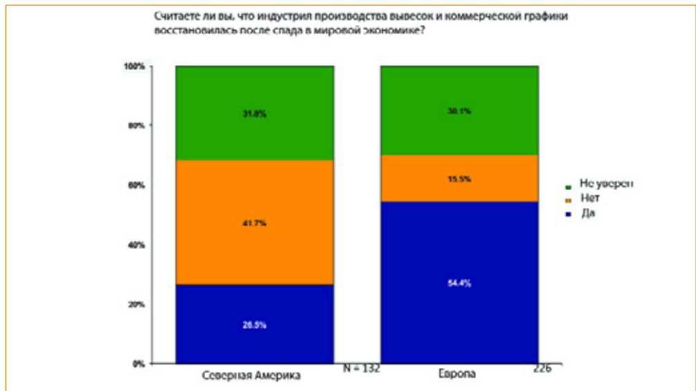
Оценка экономической ситуации в индустрии производства рекламы по состоянию на конец 2010 года (по типу компаний)