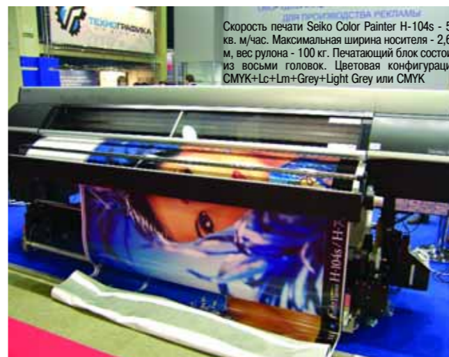
Скорость печати Seiko Color Painter H-104s - 55 кв. м/час. Максимальная ширина носителя - 2,67 м, вес рулона - 100 кг. Печатающий блок состоит из восьми головок. Цветовая конфигурация CMYK+Lc+Lm+Grey+Light Grey или CMYK

- На московской выставке «Реклама 2008» на стенде компании LRT был впервые в России представлен Seiko Color Painter H-104s. Машина вызвала большой интерес посетителей. Расскажите о ней подробнее.